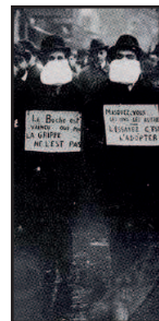
Manifestation en faveur du port d'un masque hygiénique à Paris en 1918