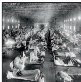
Les hôpitaux du monde entier sont bondés. A Lyon, on procède aux inhumations jour et nuit. On entasse les cadavres plus qu'on ne les enterre.

Avec un bilan mondial aussi lourd, cette épidémie reste sans conteste une des plus grandes tragédies du XXème siècle.